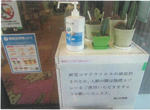
除菌スプレー設置（東入口・西入口・トイレ前・ホール中央の4か所）